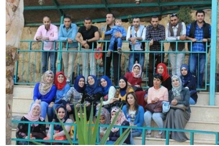
جمعية بيت دافئ عضو في شبكة حماية الطفولة