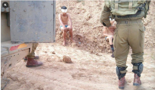
תמונה שצולמה על ידי חייל בעת מעצר קטינים בגדה המערבית ושלחה ל"שברים שתיקה"