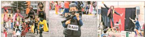
Les marionnettes de la famille géant de l'association Nuits Méris ont pris part aux célébrations.