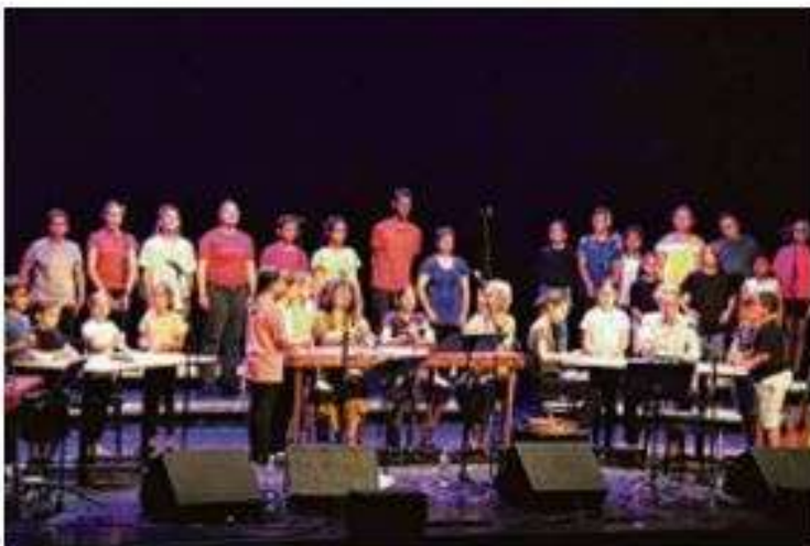
Les élèves de primaire et de collège ont partagé la scène pour entonner des chants sur le labeur des femmes méditerranéennes.

Pour ce 30e festival au plan d'eau Saint Suspi, l'association Nuits Métis a présenté au théâtre La Colonne son dernier projet d'éducation artistique et culturelle, Tempo Métis.