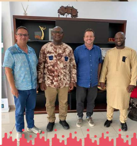
Rencontre avec Mr Alpha Soumah Ministre de la Culture