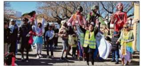
Le carnaval organisé par le centre social La Carraire a réuni près de 200 personnes.