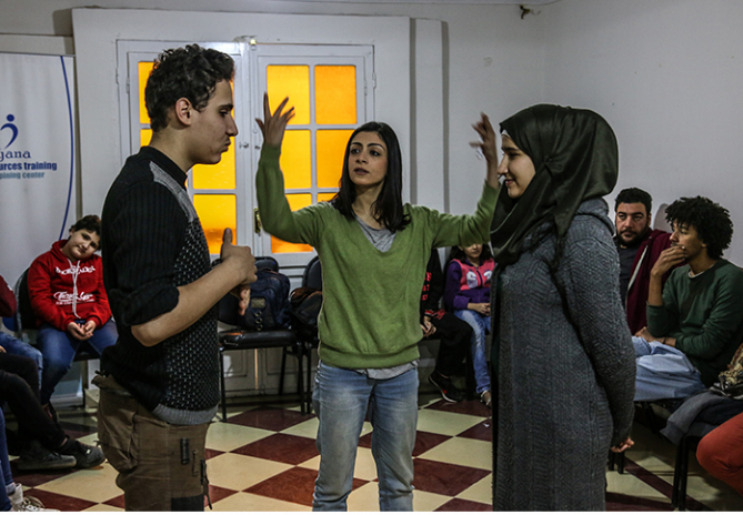
نشاط الورشة ثلاثة عروض تجريبية