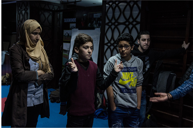
عرضان (مسرح مقروءين)