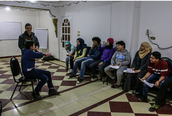
عرض حكي وغناء.