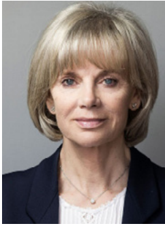
اليزابيث غيغو (2015 حتى الآن / فرنسا)

ويتولى المدير التنفيذي إدارة المؤسسة ويحضر البرنامج والميزانية ويعين ويرأس الموظفين ويحضر اجتماع مجلس الحاكمين ويعمل كممثلها القانوني.