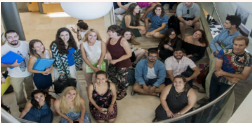
شاركت 225 منظمة مجتمع مدني في الشبكة الإسرائيلية

وعلى إثر إطلاق مؤسسة أنا ليند لعام 2009 مبادرة "استعادة الثقة، إعادة بناء الجسور" طور المجتمع المدني الإسرائيلي مشاريع تعاون محلية وإقليمية بما في ذلك "النقب غير مسدود! يتعلم البدو والمواطنون اليهود معاً عن التنمية المستدامة" و"العودة إلى حيفا" والحدث الثقافي واسع النطاق "خط الحدود". وفي إطار حملة "1001 إجراء من أجل الحوار" (2008) ركزت الإجراءات الشعبية - بما في ذلك مبادرة "إرث جدي" - على معالجة قضايا التراث الثقافي مع الشباب.