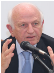
الرئيس أندريه أنزلاوي (2008 حتى 2014 / المغرب)